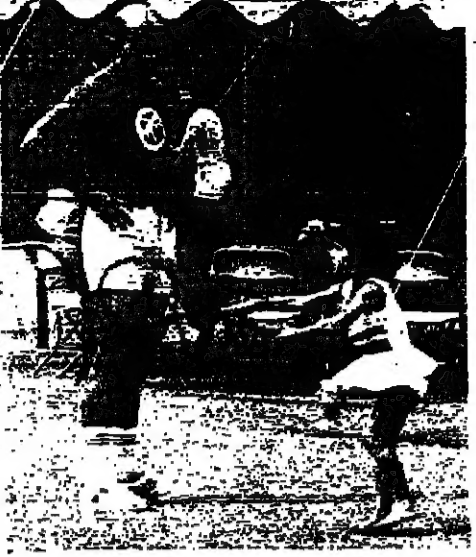
لاعب التنس بوب هويت (اليمين) مع ابنته (اليسرى) في فترة استراحة بين المباريات التي تقام في نطاق بطولة التنس العالمية في نورست هيلز